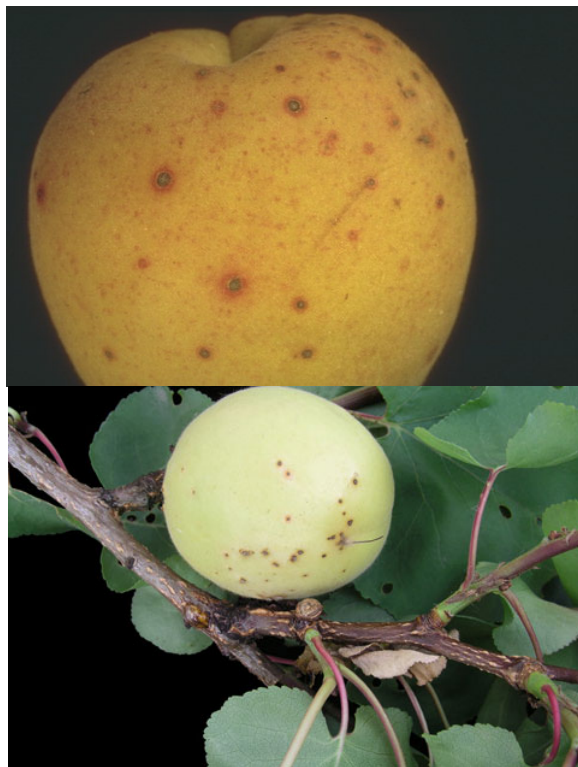
Εικόνα 2. Προσβολή από Κορύνεο σε φύλλα και καρπούς Βερικοκιάς